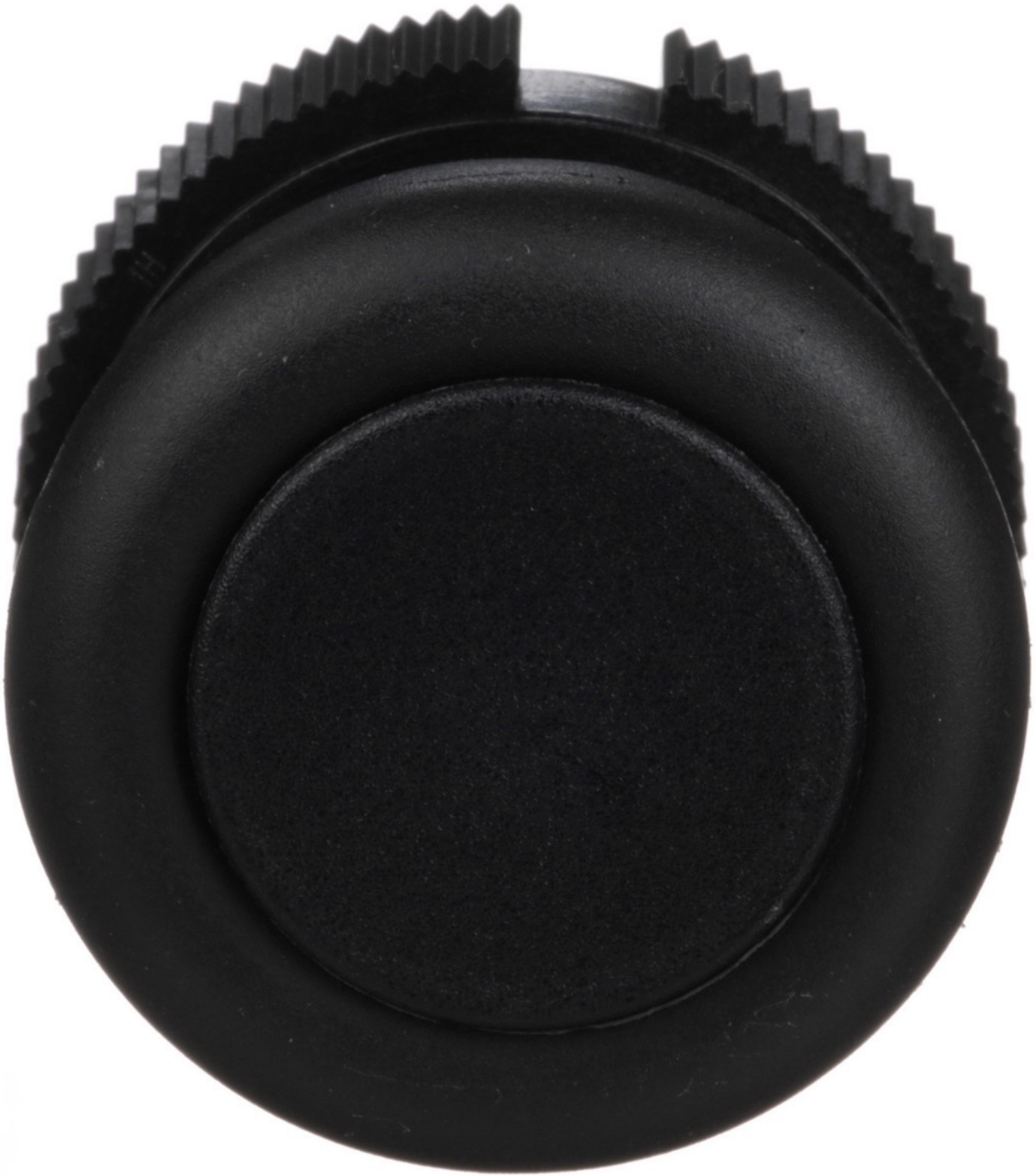
XACA9412 - Head for push button, Harmony XAC, plastic, black ...